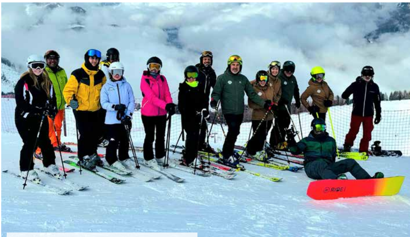
SCI CLUB SORBOLO

Esistono realtà che vanno ben oltre lo sport e che diventano veri e propri pilastri di una comunità: lo Sci Club Sorbolo è una di queste.